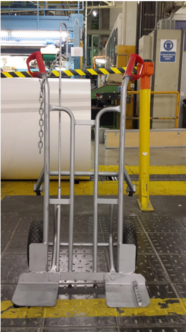
... eine modifizierte Sackkarre ...